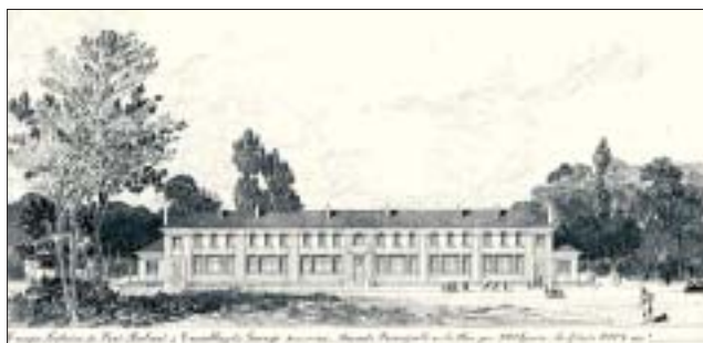
Jean Jaurès : élévation nord, 1930.

■ L'école, jusque-là attenante au bâtiment de la Poste, fut agrandie en 1932 pour permettre d'accueillir les enfants du Vieux-Pays. Les écoles de garçons et de filles forment deux bâtiments distincts, certes placés dans le même alignement sur rue et dotés d'élévations symétriques, mais ce parti pris introduit une variation qui n'avait pas été expérimentée jusque-là. D'autre part, le traitement des élévations, plus simple, laisse deviner une évolution vers des projets débarrassés du langage des années 1920. Depuis 1995, les locaux ont été mis à la disposition de quelques associations.