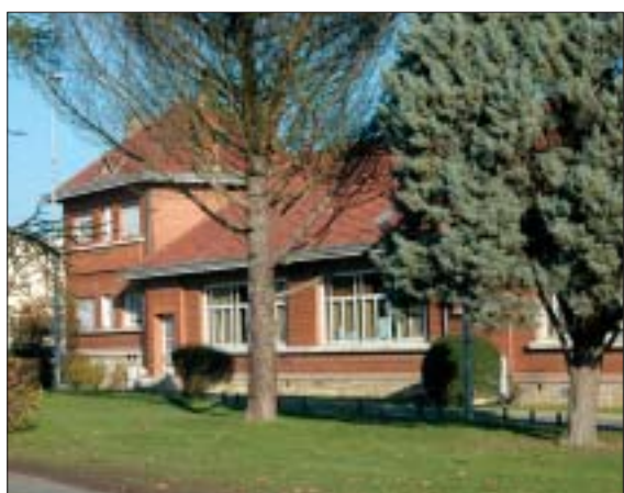
Eugène Varlin, élévation, 1936.