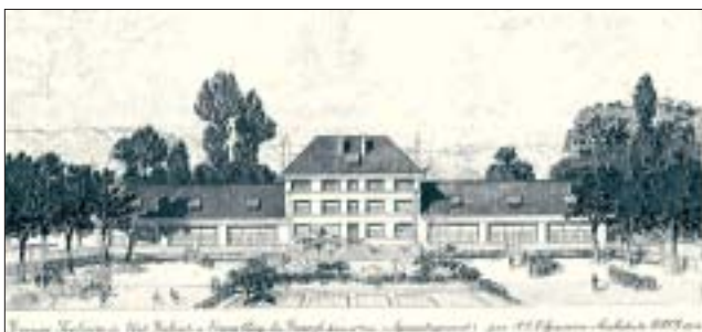
Jean Jaurès : élévation sud, 1936.