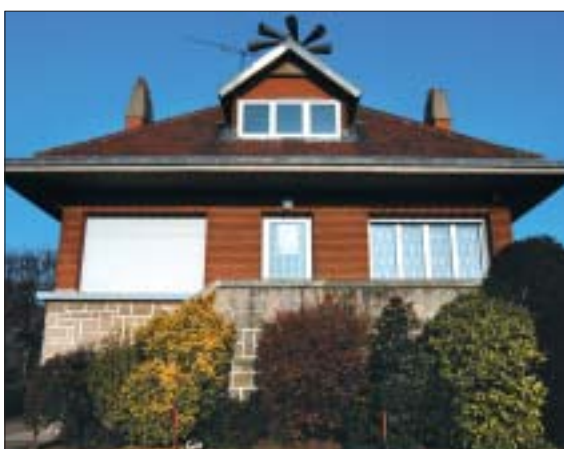
Eugène Varlin, pavillon du concierge.

■ Construit également en deux temps, cet établissement confirme l'évolution architecturale de Chauvin dans les années 1930. Le bâtiment nord possède une typologie identique à celle du groupe de Nonneville et à celle de l'école des garçons du groupe Varlin, mais le bâtiment sud, construit six ans plus tard, est traité avec davantage de simplicité : refus de l'utilisation des ordres, ruptures de hauteur, briques aux joints creux. Les références aux avant-gardes du mouvement moderne apparaissent même sous la forme de hublots et de baies à l'horizontalité très prononcée.