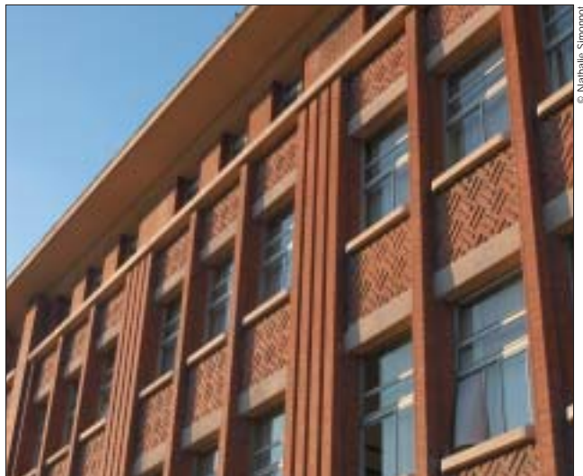
Les Prévoyants : le travail sur les allèges.