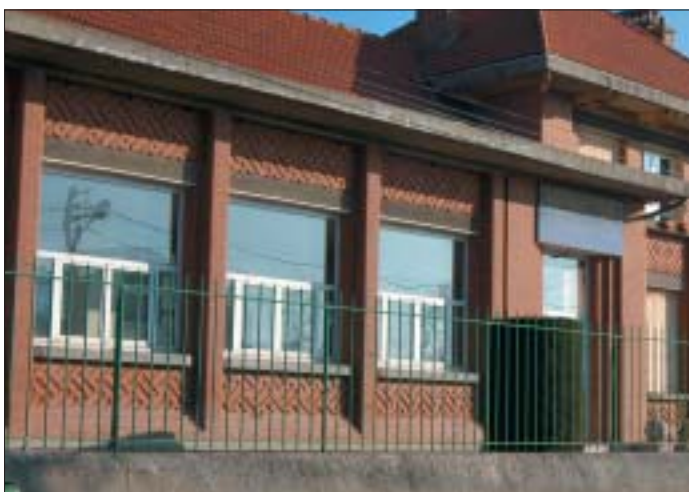
Branly, vue d'ensemble.