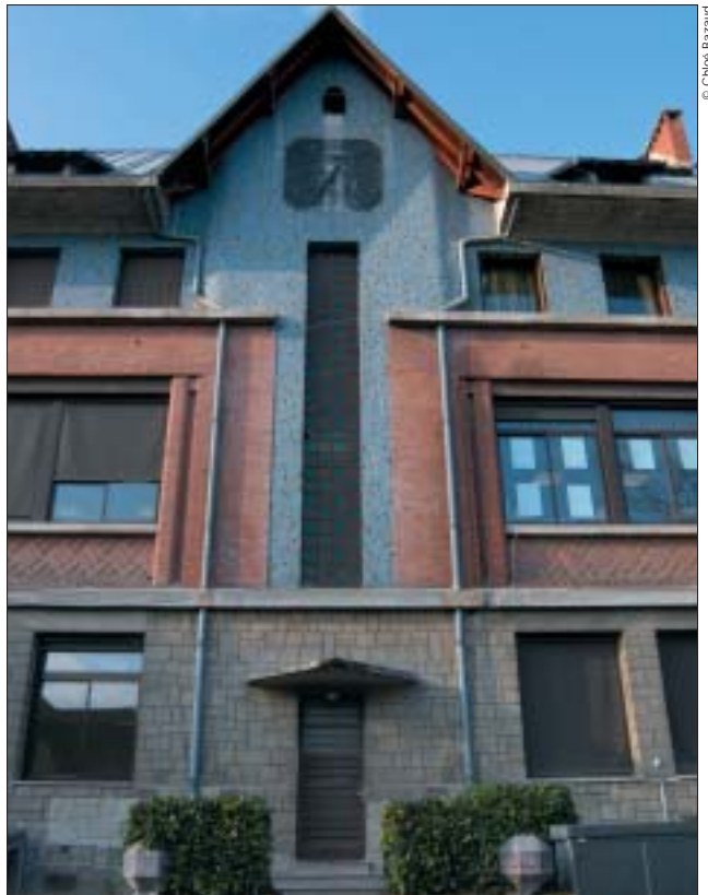
Trois niveaux, trois couleurs, trois matériaux.