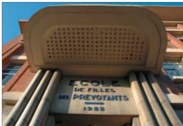
Les Prévoyants : détail de l'entrée.