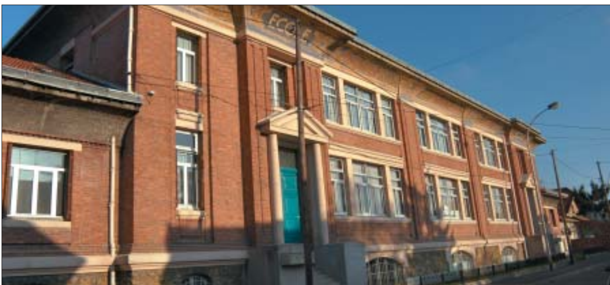
Elévation rue de Toulouse, école de filles.