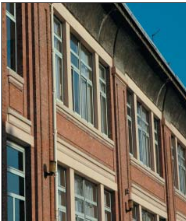
Elévation côté cour, école de garçons.

La composition d'ensemble est parfaitement symétrique. Cette disposition, commune à de nombreux groupes scolaires français construits sous la III e République, était facilitée par la division entre école de garçons, rue de la Division Leclerc, et école de filles, rue de Toulouse, imposée par le programme.