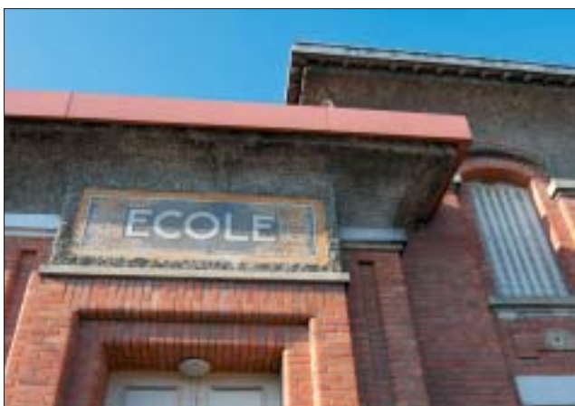
Eugène Varlin, élévation, 1929.