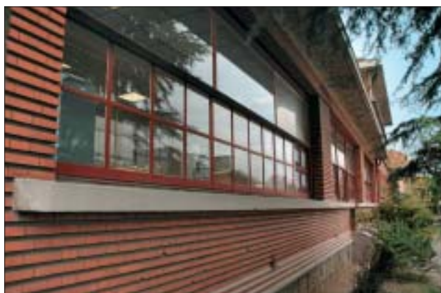
Jean Jaurès : élévation sud, détail.