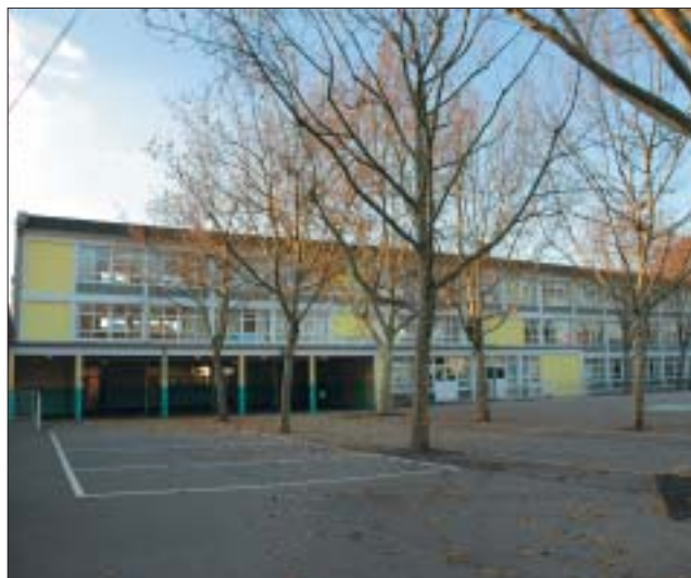
Le collège Vercingétorix.