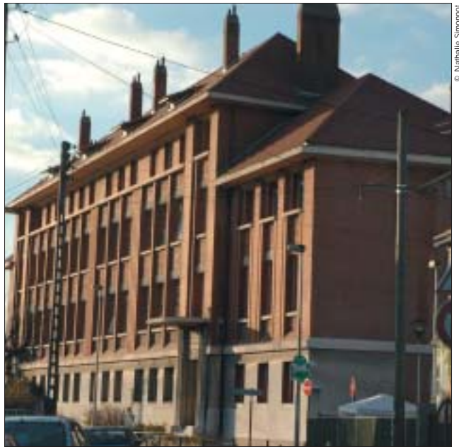
Les Prévoyants : vue d'ensemble.