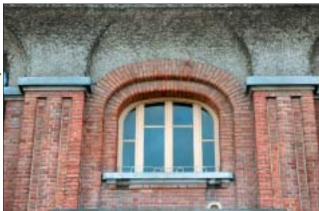
Jean Jaurès : élévation nord, détail.