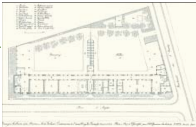
Un plan légèrement asymétrique.