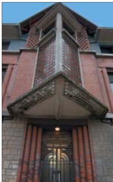
Une avancée triangulaire sertie de verres colorés.