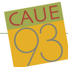
Illustration : © Balthazar B