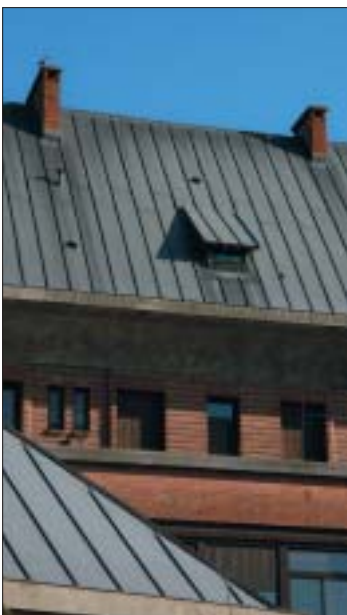
Détail de l'élévation sur cour.