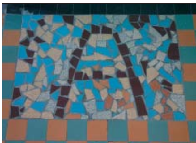
Les mosaïques au sol.