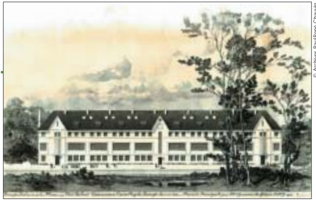
Élévation sur rue.

■ En contrepoint de l'école de Nonneville à Aulnay-sous-Bois, le collège Romain Rolland est une des dernières constructions scolaires de l'architecte. Cet écart de moins d'une dizaine d'années entre les deux réalisations a néanmoins creusé une différence significative, à la fois dans la conception de l'école comme lieu d'apprentissage, mais également dans le traitement des élévations, les matériaux employés et les motifs décoratifs utilisés. Destiné à la population du nord du Vert-Galant, le bâtiment est curieusement inséré dans le tissu pavillonnaire, sur une parcelle d'angle irrégulière qui a imposé l'adoption d'un plan légèrement asymétrique. Le bâtiment ramassé sur lui-même, émerge au-dessus des habitations et constitue un point de repère dans le lotissement même si aucune mise en valeur urbaine n'existe : pas de place, ni de perspective directe sur l'établissement depuis un quelconque point de vue, à l'exception de la rue d'Anjou qui permet d'apercevoir le pignon sud du bâtiment. Ce contexte urbain peu favorable est d'autant plus étonnant que l'école Jean Jaurès, dans le sud du lotissement, est parfaitement intégrée au tissu urbain avec une disposition symétrique sur la parcelle. En contrepartie, Chauvin soigne la relation de son bâtiment à la rue en créant une zone végétale le long de la façade principale, un dispositif de transi-