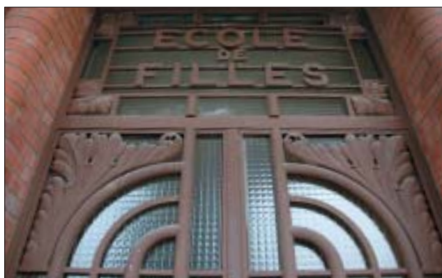
Détail de l'entrée de l'école des filles.