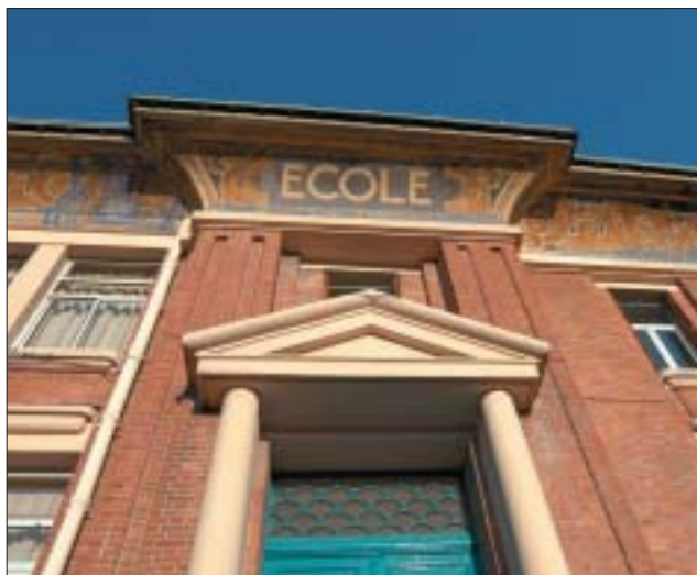
Détail de la frise : une iconographie inspirée de la nature.