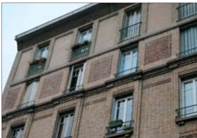
Immeuble, 4 rue Firmin-Didot à Livry-Gargan.