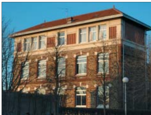
Ecole des filles du Bourg.