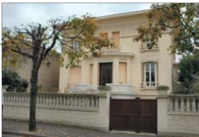
Maison du docteur Marty.

À l'échelle de la ville, une cité-jardin située sur la partie nord-ouest de la commune, a été construite dans les années 1950 sur des crédits du ministère de la Reconstruction et de l'Urbanisme. Il s'agit de l'unique cité-jardin d'Aulnay-sous-Bois, d'autant plus intéressante à étudier que chaque logement a coûté environ un million de francs à la construction. Trois ans avant le « concours million » de 1955, qui a lancé l'édification à grande échelle de logements collectifs, le modèle que propose les deux architectes montre la possibilité de réaliser une cité de maisons individuelles sur des budgets identiques à ceux des futures cités d'habitation. Cinquante logements de trois pièces répartis dans des pavillons jumelés ont été organisés autour d'espaces verts. Chaque maison possède un cellier extérieur dont certains ont été recon-